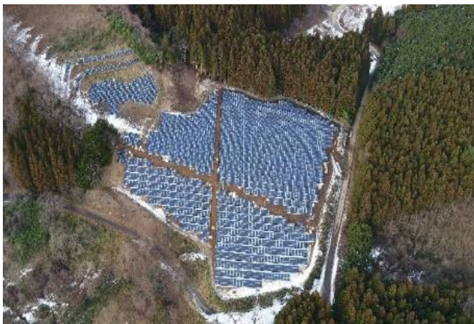
Nihonmatsu 3 -1.5MW